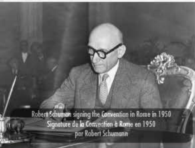
Robert Schuman signing the Convention in Rome in 1950 Signature de la Convention à Rome en 1950 par Robert Schumann

Depuis son adoption, la Convention a été amendée plusieurs fois et enrichie de nombreux droits qui sont venus compléter le texte initial.