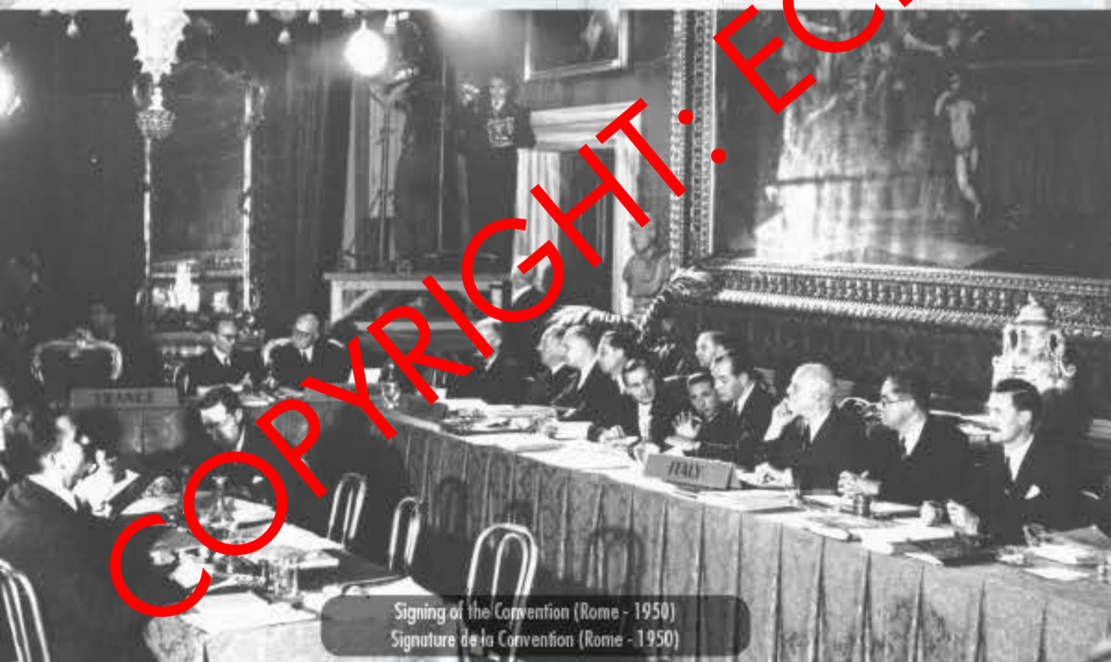
Signing of the Convention (Rome - 1950) Signature de la Convention (Rome - 1950)